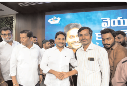
చిలమత్తూర్ (రూరల్), డిసెంబర్ 19 సూర్య న్యూస్ మాజీ సీఎం జగన్మోహన్ రెడ్డి ని తాడేపల్లి క్యాంప్ ఆఫీస్ నందు మర్యాదపూర్వకంగా చిలమత్తూర్ మండల వైఎస్ఆర్సిపి